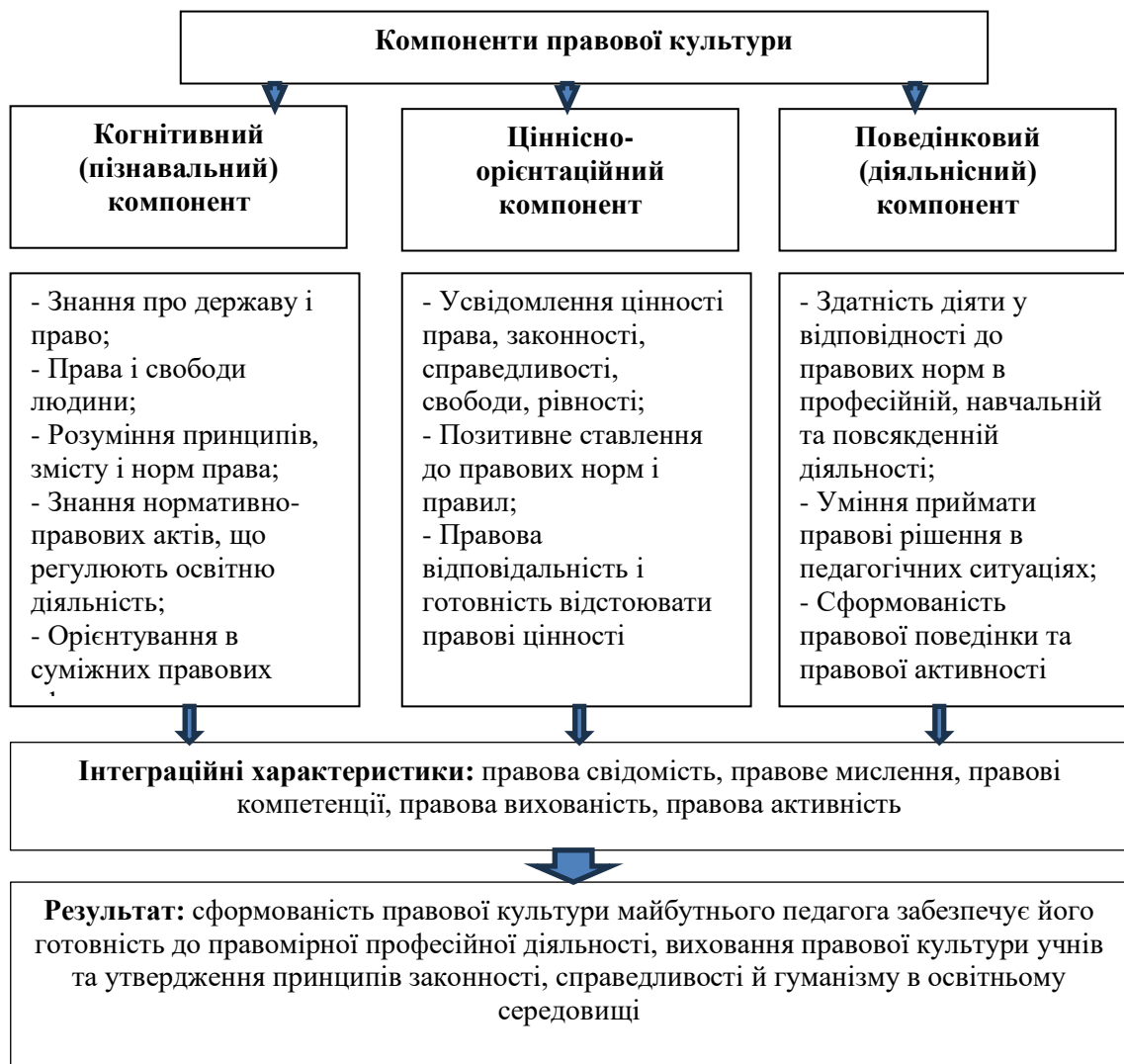
Рис.1. Структура та характеристики правової культури в контексті педагогічної діяльності