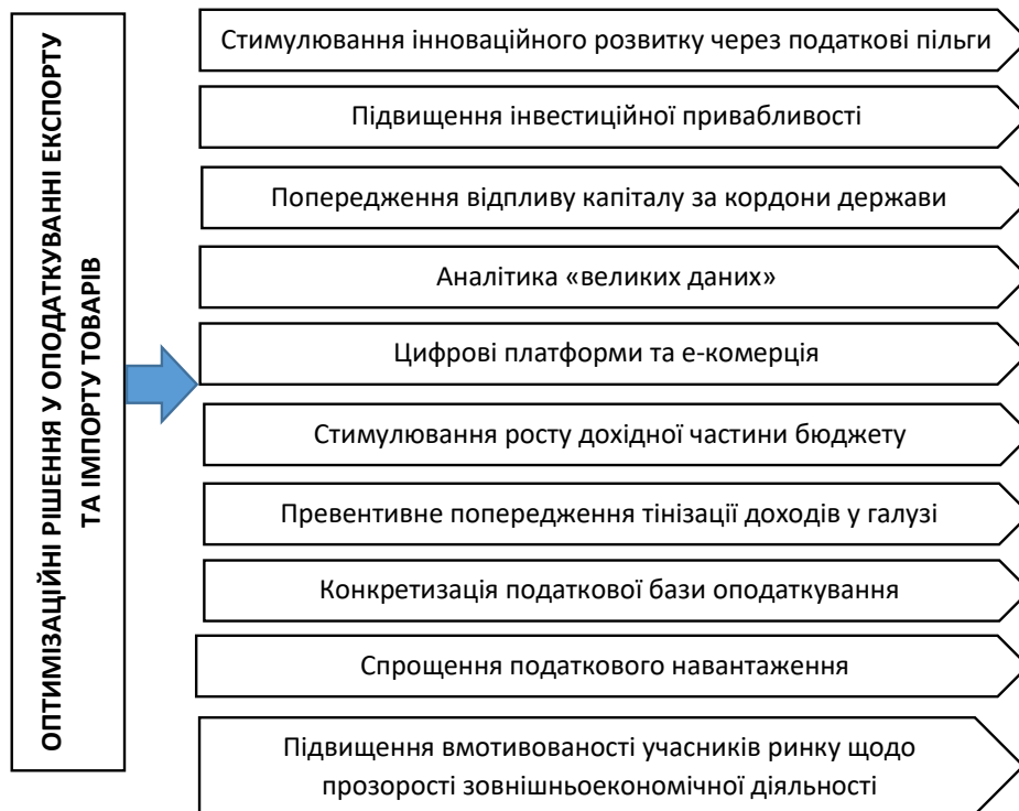
Рис. 2. Оптимізаційні рішення щодо оподаткування експорту та імпорту у період воєнного стану та повоєнного відновлення