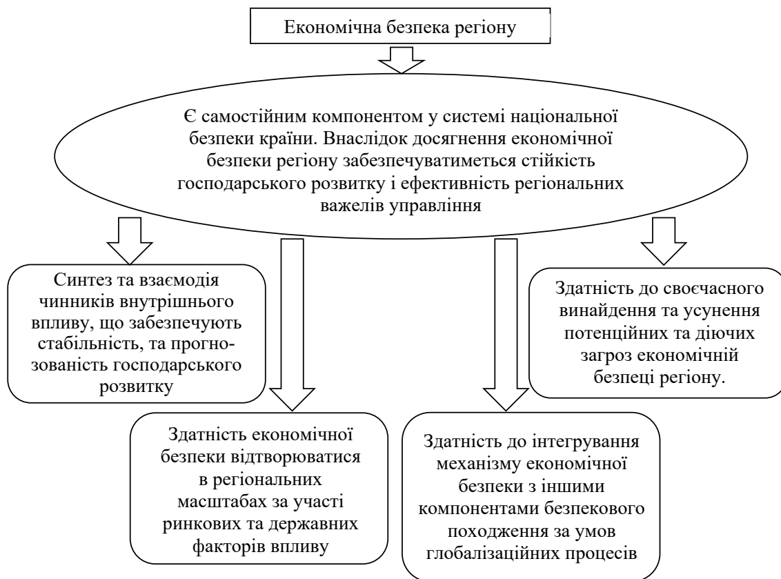
Рис. 1. Характеристика складових економічної безпеки регіону