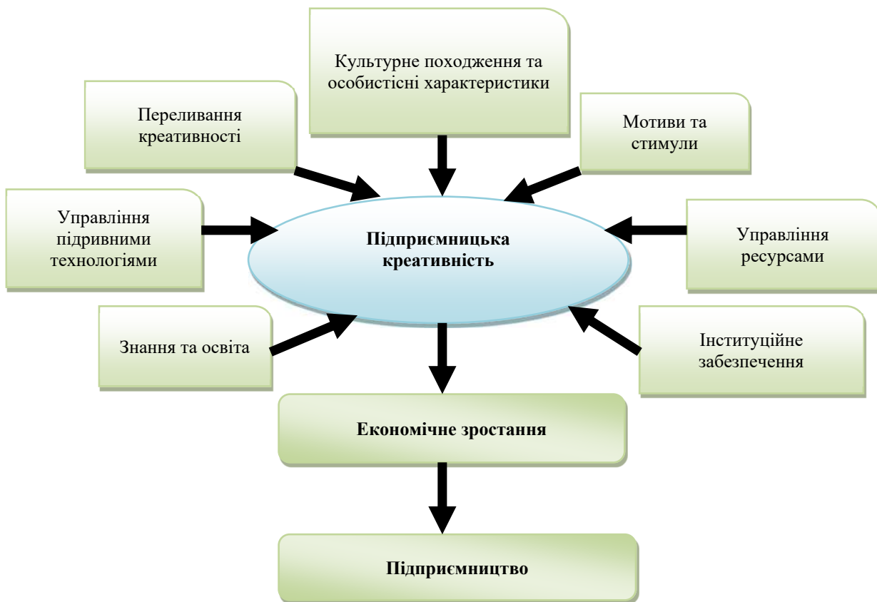
Рис. 1. Фактори, що формують підприємницьку креативність

П. Кук вбачає в креативності головне джерело конкурентоспроможності для організацій, що діють в хаотичному і нестабільному середовищі, а також в умовах наявності безлічі схожих