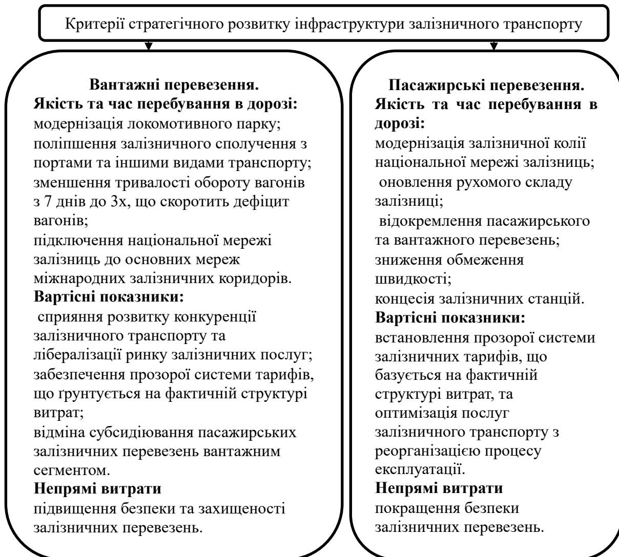
Рис. 3. Критерії стратегічно орієнтованого відтворення інфраструктури підприємств залізничного транспорту

Для формування ключових цілей та напрямів розвитку підприємства, із врахуванням існуючих ресурсів та можливості залучення потрібних для досягнення поставленої мети — необхідне стратегічне управління. Успішне стратегічне управління має пряму залежність від ефективності