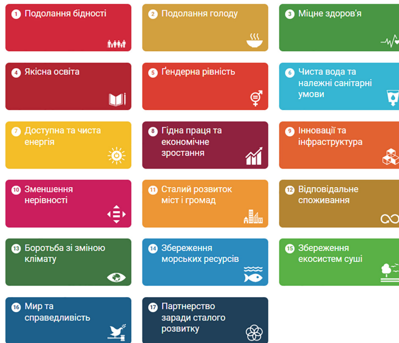
Рис. 1. 17 Цілей сталого розвитку [8]

дорослого населення і сукупним валовим коефіцієнтом, що надійшли в початкові, середні та вищі навчальні заклади; гідний рівень життя, що оцінюється шляхом аналізу величини ВВП на душу населення відповідно до паритету купівельної спроможності;