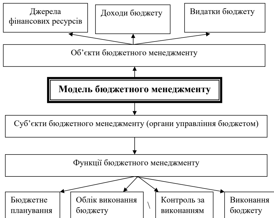
Рис. 1. Модель бюджетного менеджменту