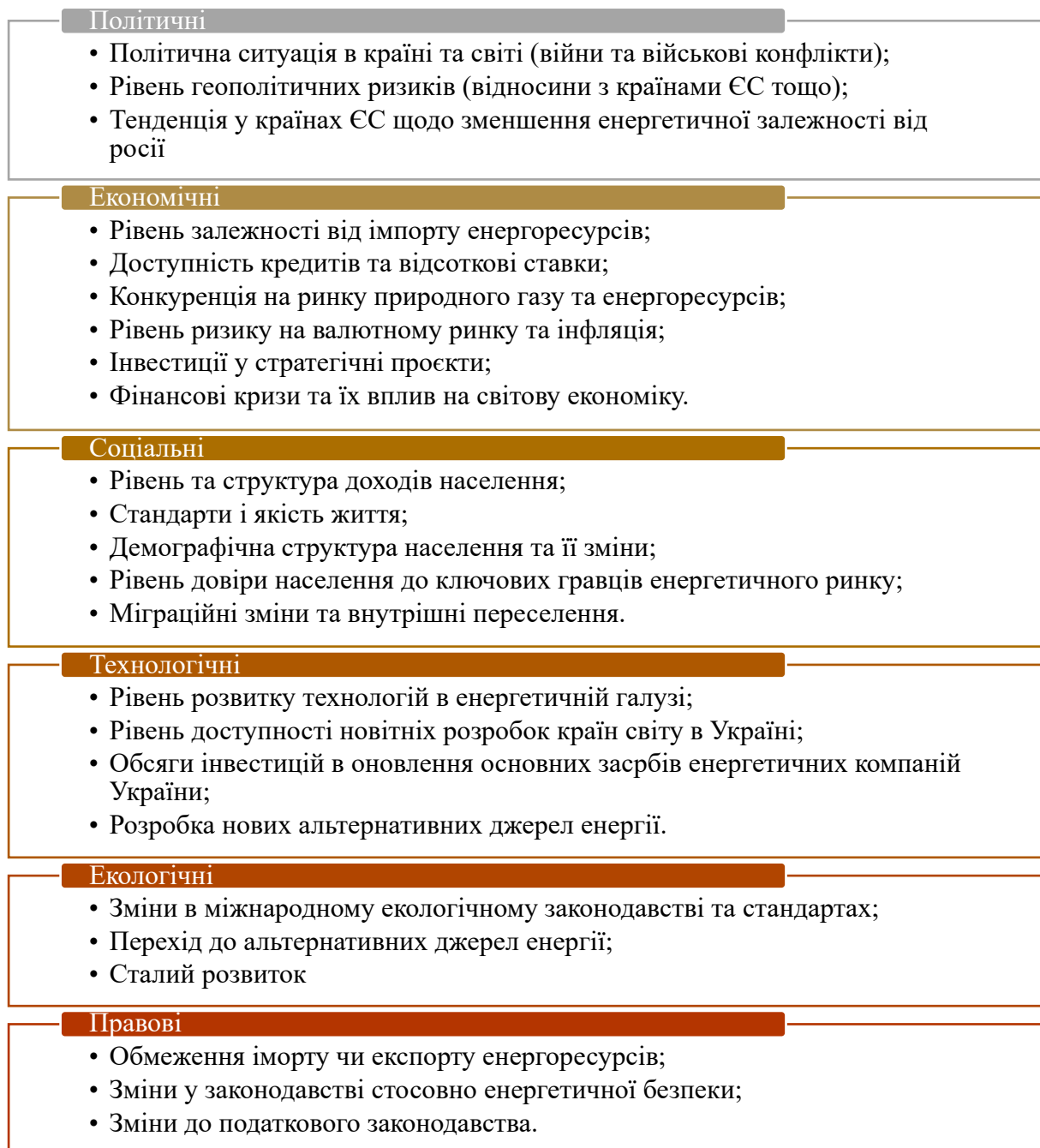
Рис. 1. PEST-аналіз чинників, що впливають на фінансовий розвиток НАК «НАФТОГАЗ УКРАЇНИ»

Для цього спершу проведемо PESTEL-аналіз (рис. 1), який дозволяє оцінити чинники зовнішнього середовища, які впливають на функціонування НАК «НАФТОГАЗ УКРАЇНИ» та його фінансовий розвиток, а отже дозволяють ідентифікувати існуючі можливості та загрози.