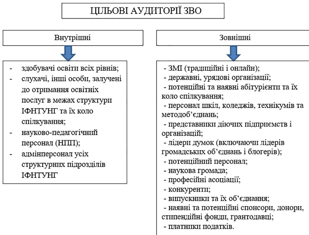
Рис. 3. Цільові аудиторії ЗВО

Формування ринкових стратегічних орієнтирів розвитку освітньо-наукової екосистеми університету для всебічного професійного, інтелектуального