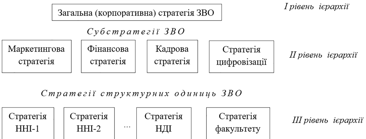
Рис. 2. Модель загальної (корпоративної) стратегії ЗВО