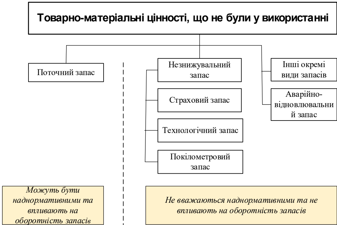
Рис. 2. Склад товарно-матеріальних цінностей, що не були у використанні