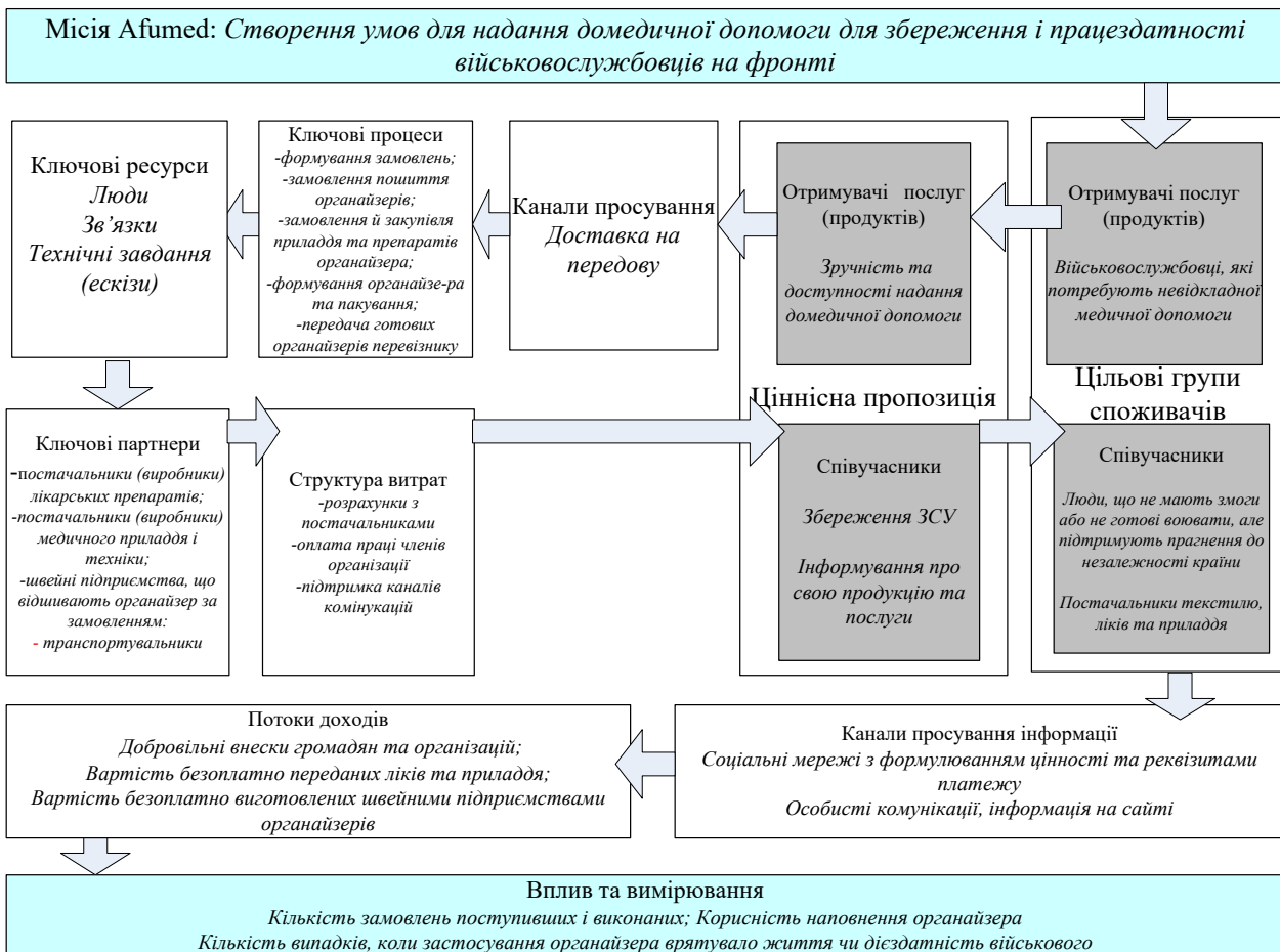
Рис. 3. Бізнес-модель волонтерської організації Afumed

Для другої підгрупи співучасників каналами виступатимуть як особисті комунікації членів організації, так і інформація на сайті компанії. До інформації на сайті мають бути включені логотипи ключових партнерів, а також донорів. Це буде запорукою своєрідної реклами постачальника-