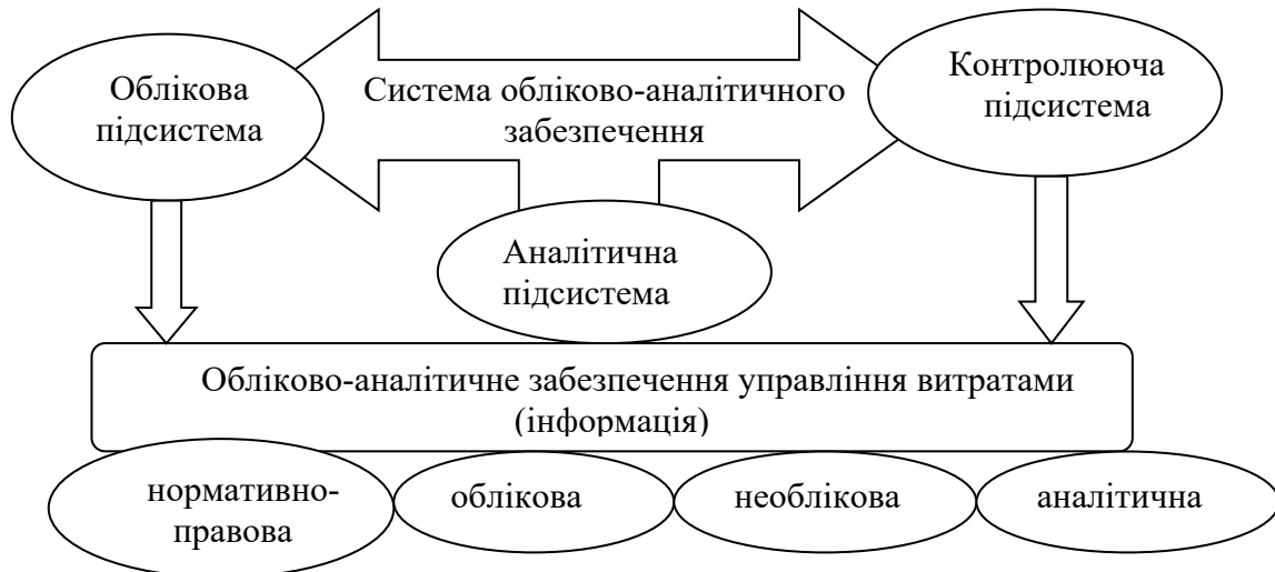
Рис. 3. Підсистеми обліково-аналітичного забезпечення управління витратами виробництва продукції тваринництва

Аналітична інформація є результатом обробки та узагальнення вхідних даних стосовно господарської діяльності галузі тваринництва. Своєчасна та достовірна аналітична інформація дає можливість оцінити як минулі й теперішні події, так і майбутні операції, а відтак — вжити заходів, спрямованих на оптимізацію витрат виробництва продукції тваринництва. За даними такої інформації можна ви-