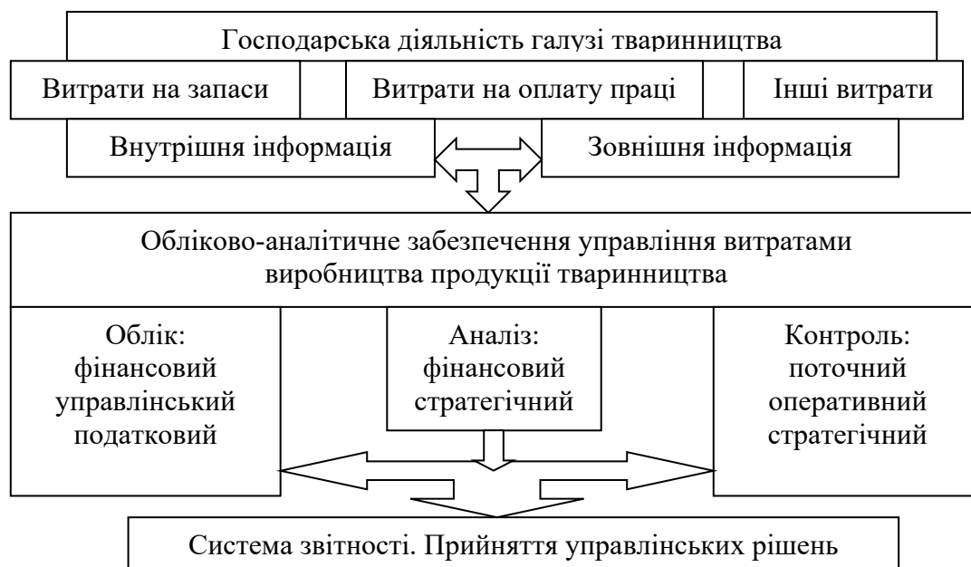
Рис. 2. Обліково-аналітичне забезпечення управління витратами виробництва продукції тваринництва

Необлікова інформація включає в себе матеріали різних перевірок (аудиторських та фінансових груп); пояснювальні та доповідні записки; матеріали засобів масової інформації тощо.