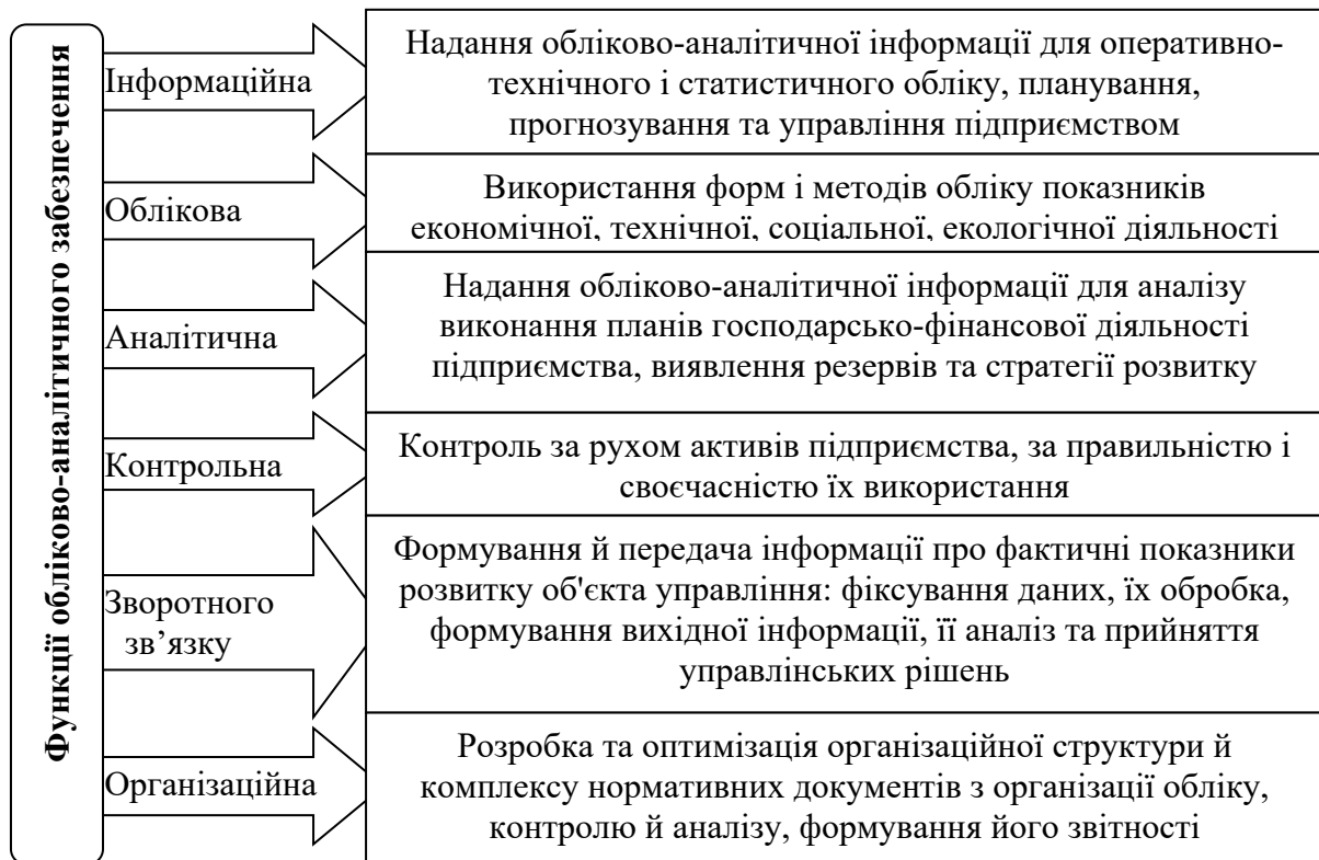
Рис. 4. Функції обліково-аналітичного забезпечення управління витратами виробництва продукції тваринництва

значити відхилення від встановлених нормативних показників з метою прийняття рішень, спрямованих на попередження та усунення негативних змін у складі виробничих витрат галузі. Інформація з облікової підсистеми потрапляє в аналітичну підсистему та підсистему контролю, де реалізуються їх функції. У випадку виникнення відхилень від нормативних параметрів, контрольна функція