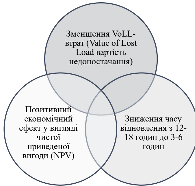
Рис. 1. Комплементарні проблеми, які розв'язують енергетичні острови

визначається їхньою здатністю зменшувати вартість недопостачання електроенергії (VoLL–Value of Lost Load), скорочувати час відновлення енергопостачання з 12–18 годин до 3–6 годин та формувати позитивний економічний ефект у вигляді чистої приведеної вигоди. Структура витрат (CAPEX + OPEX) на створенні енергетичних островів в місті Житомир представлена в таблиці 3.