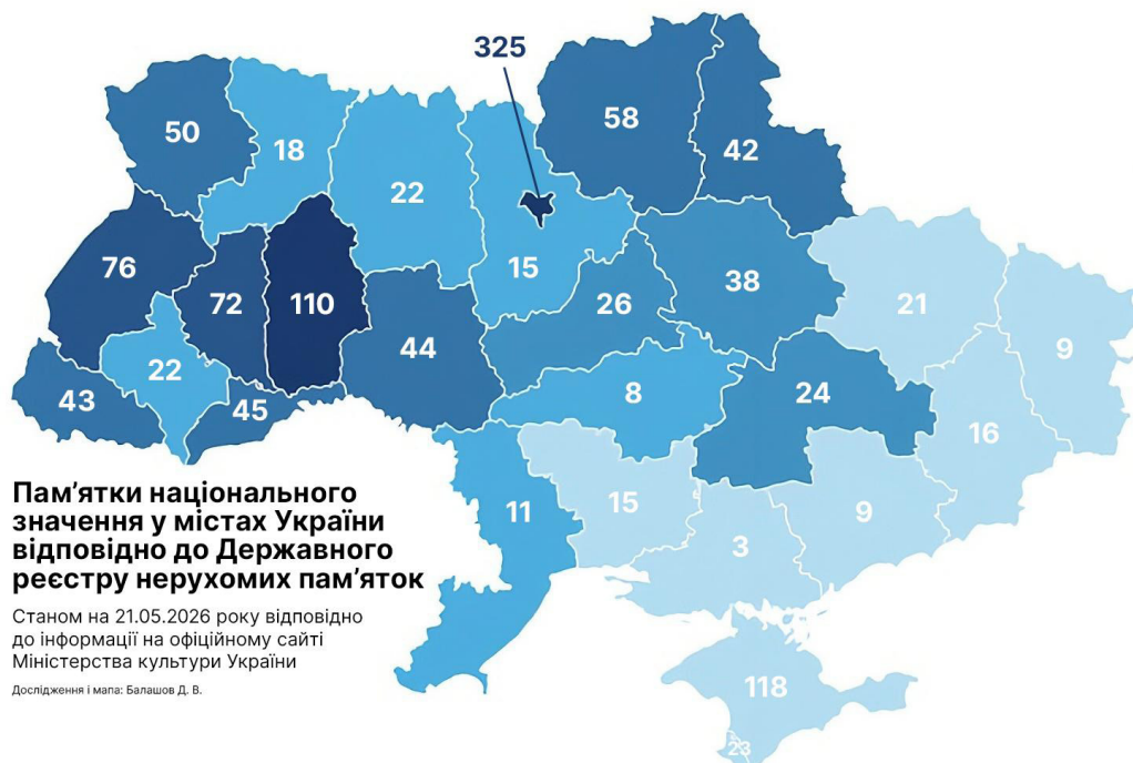
Рис. 3. Розподіл пам'яток національного значення у містах України відповідно до Державного реєстру нерухомих пам'яток

Розподіл кількості пам'яток національного значення у містах у визначених областях і м. Києві наведений у рис. 3: