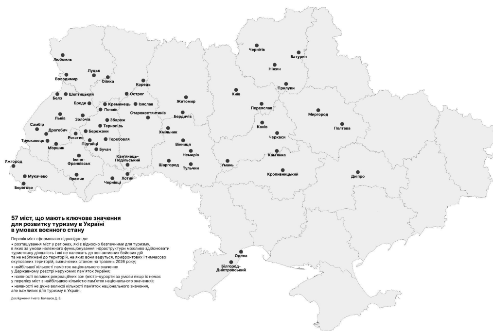
Рис. 5. Міста України, що мають ключове значення для розвитку туризму в Україні в умовах воєнного стану

Примітка: у дужках зазначено загальну кількість пам'яток на території міської громади, а не тільки безпосередньо в місті