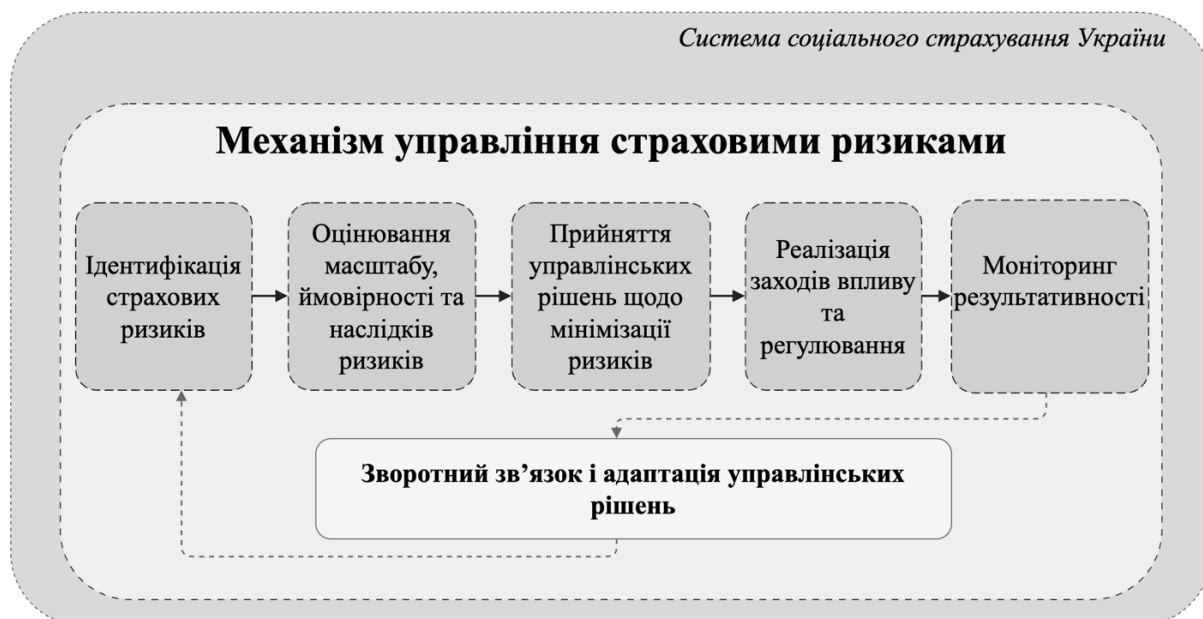
Рис. 2. Механізм управління страховими ризиками в системі соціального страхування України

Управління страховими ризиками в цій системі має спиратися на логіку послідовного ризик-менеджменту. На першому етапі має здійснюватися ідентифікація ризиків, тобто виявлення факторів,