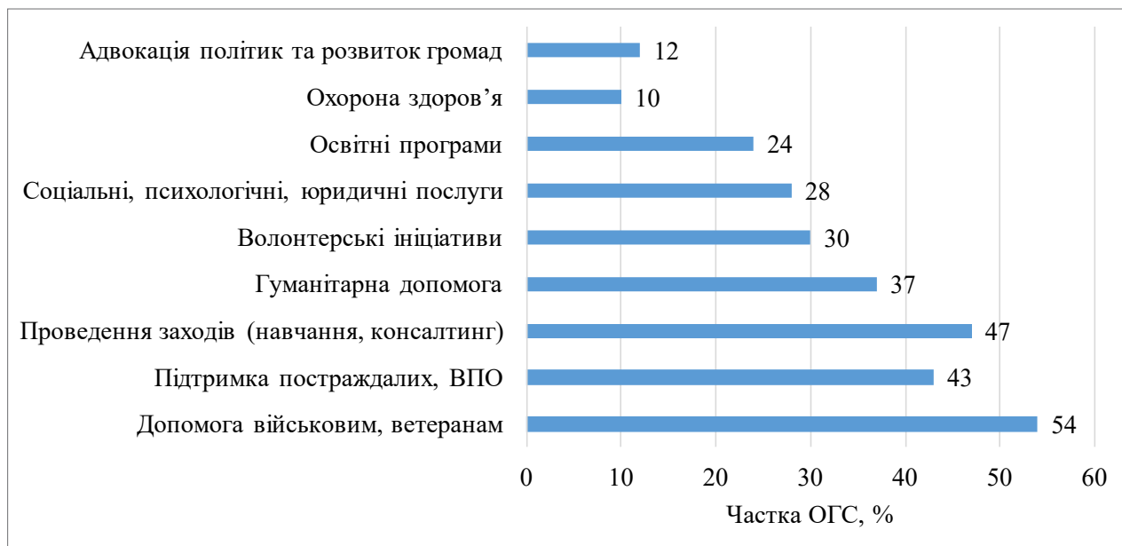
Рис. 2. Основні напрями діяльності громадських організацій в Україні у 2022–2025 рр.

Зростання кількості громадських організацій відображає розширення їх інституційної присутності, однак не дає повного уявлення про характер їх діяльності, ефективність використання ресурсів і реальний внесок у розвиток територіальних громад [17; 18]. Формування кількісної бази є лише передумовою, тоді як ключового значення набуває функціональна спрямованість діяльності організацій, яка визначає можливості їх участі в реалізації публічної політики та інтеграції у систему публічних закупівель. Водночас кількісне зростання громадських організацій не відображає повною мірою їх функціонального потенціалу, що потребує аналізу напрямів їх діяльності (рис. 2).