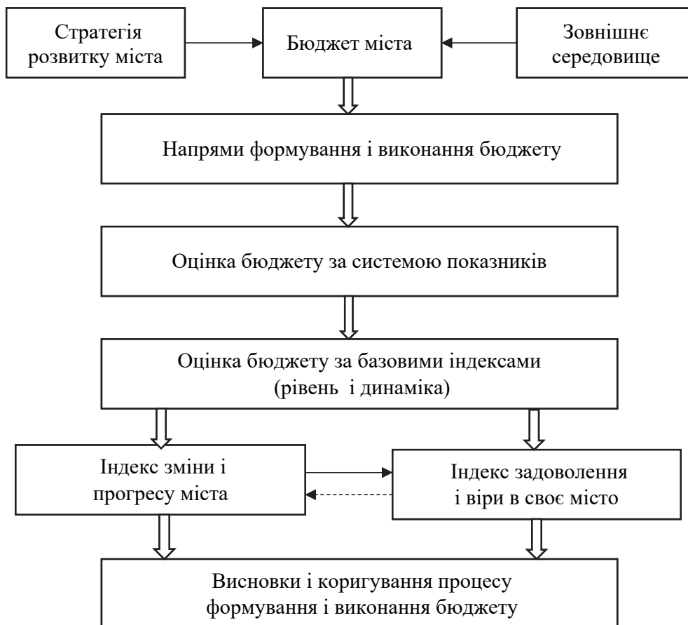
Рис. 1. Інноваційні аспекти оцінки бюджету міста

Мета індексу задоволення і віри в своє місто безпосередньо пов'язана з людиною, коли весь бюджет