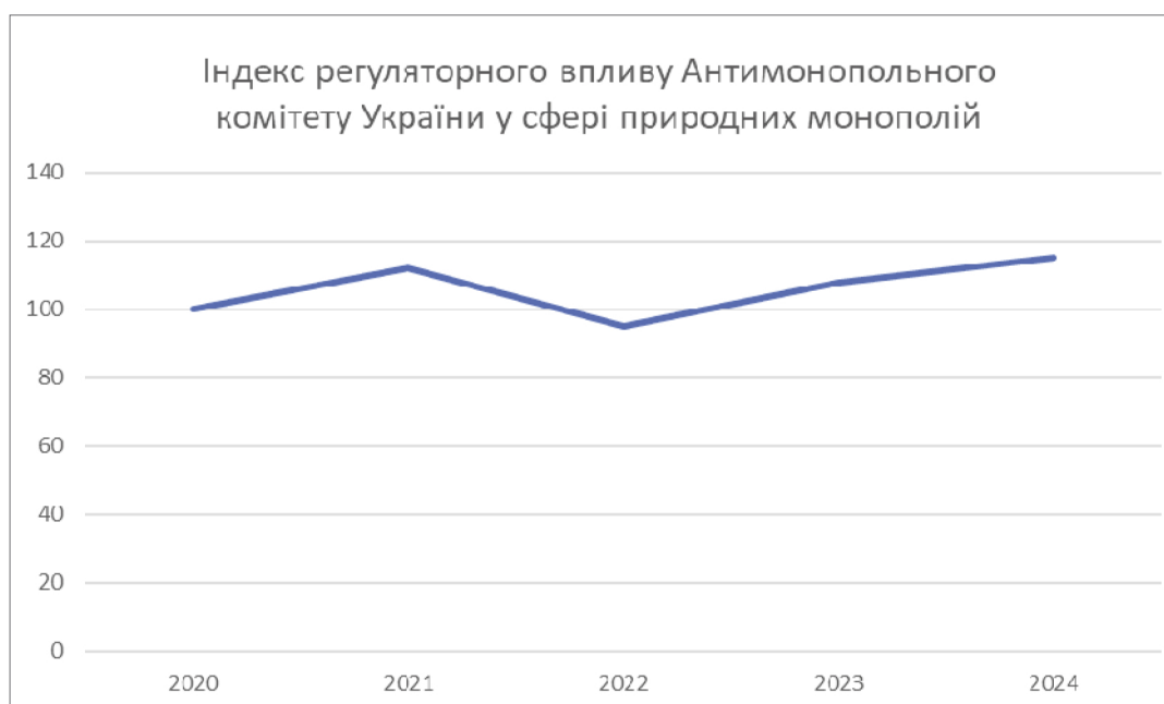
Рис. 3. Динаміка індексу регуляторного впливу Антимонопольного комітету України у сфері природних монополій у 2020–2024 роках

Дані, наведені на рисунку 3, свідчать про нерівномірну динаміку регуляторного впливу Антимонопольного комітету України у 2020–2024 роках із тенденцією до його посилення у 2023–2024 роках. Зазначені коливання відображають зміну