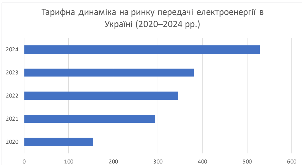
Рис. 1. Тарифна динаміка на ринку передачі електроенергії в Україні (2020–2024 рр.)

Оцінку ефективності діяльності суб'єктів природних монополій доцільно здійснювати з урахуванням результатів регуляторного та антимонопольного контролю. Аналіз ефективності діяльності суб'єктів природних монополій доцільно здійснювати з урахуванням результатів регуляторного та антимонопольного контролю. Узагальнення даних річних звітів Антимонопольного комітету України за 2020–2024 роки свідчить, що динаміка відповідних показників мала нерівномірний характер. Зокрема, у різні роки фіксувалися суттєві коливання кількості припинених порушень законодавства про захист економічної конкуренції, яка за даними річних звітів Антимонопольного комітету України у різні роки змінювалася у діапазоні кількох сотень справ на рік, а також обсягу звернень і скарг суб'єктів господарювання та споживачів, що відображало зміну інтенсивності конкурентних проблем на регульованих ринках.