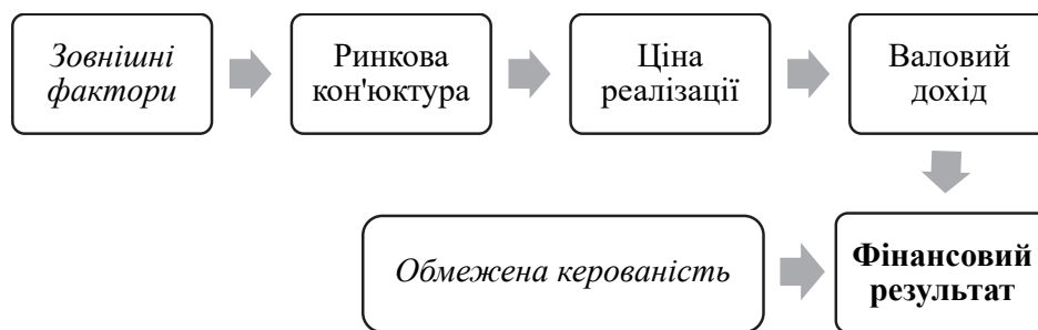
Рис. 3. Взаємозв'язок ринкових цін і фінансового результату

Разом із ринковими механізмами фінансові результати аграрних підприємств визначаються також інституційними та організаційними чинниками, зокрема податковою політикою, доступом до кредитних ресурсів і державними програмами підтримки, що