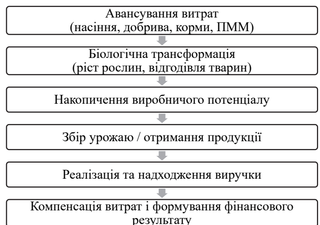
Рис. 1. Відкладений механізм формування результатів діяльності в агробізнесі

Одним із найбільш складних для прогнозування чинників, що ускладнюють формування фінансових результатів у агробізнесі, є природно-кліматичні та біологічні ризики. Погодні коливання, посухи, надмірні опади, температурні аномалії та хвороби рослин і тварин здатні суттєво змінювати обсяги та якість продукції навіть за дотримання оптимальних технологічних параметрів виробництва. У фінансовому вимірі це трансформується у нестабільність доходів, підвищення витрат та зростання ймовірності недоотримання запланованого прибутку. Біологічні активи, на відміну від традиційних виробничих ресурсів, мають властивість змінювати свою вартість у процесі росту та розвитку, що зумовлює формування частини фінансового результату ще до моменту реалізації продукції. Таким чином, фінансовий результат аграрного підприємства частково набуває умовного характеру та залежить від прийнятих методів оцінки біологічних активів. Поєднання описаних чинників формує складну багаторівневу логіку впливу на фінансові результати аграрних підприємств, у межах якої виробничі збу-