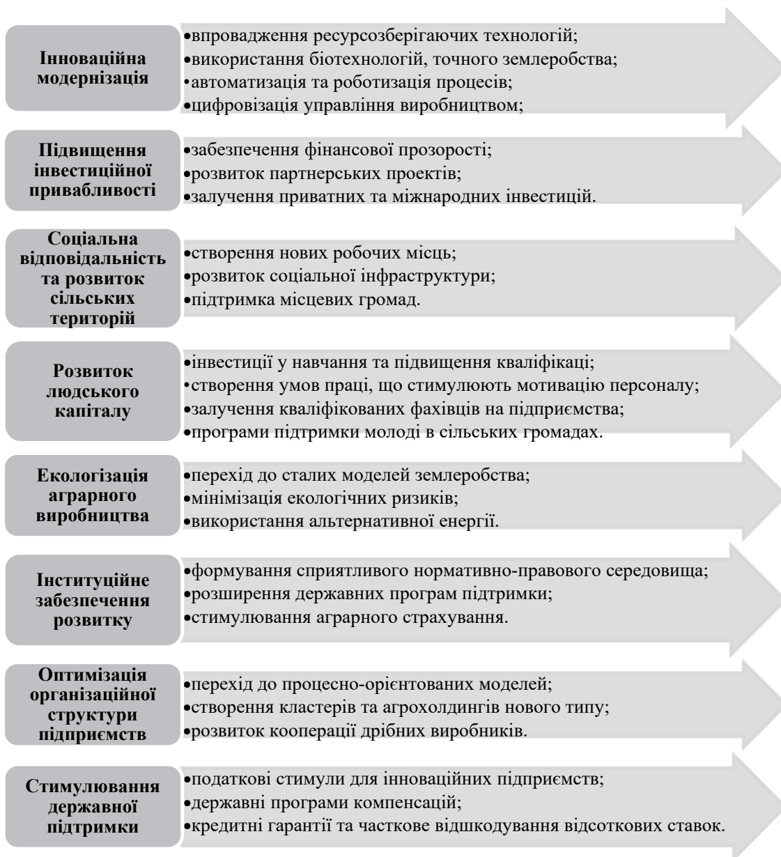
Рис. 4. Напрями удосконалення соціально-економічного розвитку суб'єктів аграрної сфери

Система розподілу бюджетних дотацій сільськогосподарським виробникам має базуватися на ринкових пріоритетах. Доцільним видається погодитися з позицією О. Бородіної, яка пропонує визначити основним критерієм надання державної підтримки погектарні виплати всім аграрним товаровиробникам незалежно від розміру підприємств чи їх організаційно-правового статусу, за умов встановлення граничних обсягів фінансування на одного суб'єкта господарювання [1]. Такий підхід забезпечить прозорість і адресність розподілу бюджетних ресурсів у агропродовольчій сфері, сприятиме підвищенню ефективності їх використання відповідно до ринкових