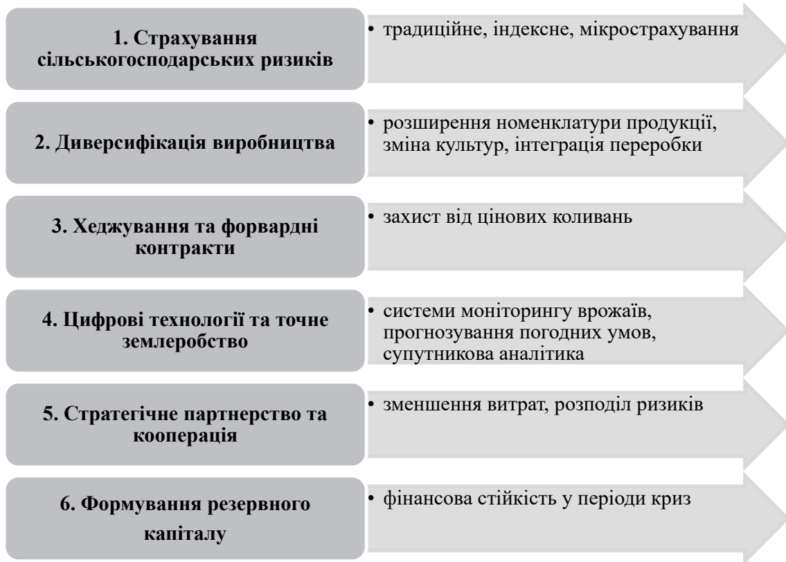
Рис. 2. Інструменти ризик-менеджменту в аграрній сфері