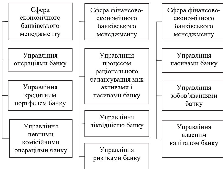
Рис. 2. Розподіл видів банківського управління за сферами економічного, фінансового і фінансово-економічного менеджменту

Така класифікація станів комерційного банку і їх зміст суттєво відрізняються від існуючої на теперішній час ситуації в банківській системі і науково-методичній літературі, де розглядають-