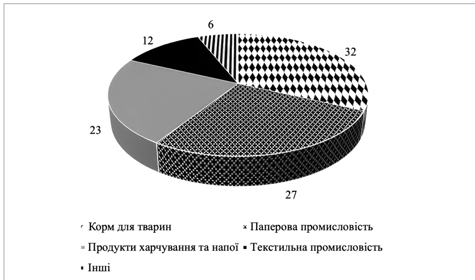
Рис. 1. Структура споживання кукурудзяного крохмалю у світі в 2023 р., %

Глобальні структурні зрушення та сформовані на їх підґрунті прогностичні моделі еволюції світового ринку кукурудзяного крохмалю переконливо засвідчують високий стратегічний потенціал цього сегмента переробної промисловості. Згідно з аналітичними оцінками, уже до 2026 р. валовий обсяг світового ринку кукурудзяного крохмалю сягне 29,39 млрд. дол. США, а до 2032 р. очікується його експансивне зростання до рівня 127,07 млрд. дол. США. Така динаміка відповідає середньорічному темпові приросту на рівні 8,2%, що свідчить про формування довготривалої висхідної траєкторії розвитку та інтенсифікацію глобального попиту на продукцію з високим функціональним і технологічним потенціалом [8].