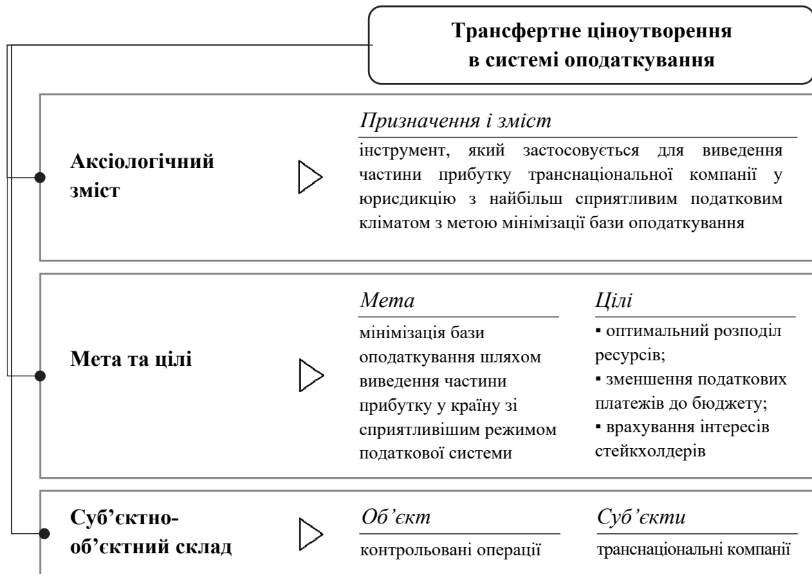
Рис. 1. Характерні особливості трансфертного ціноутворення в системі оподаткування