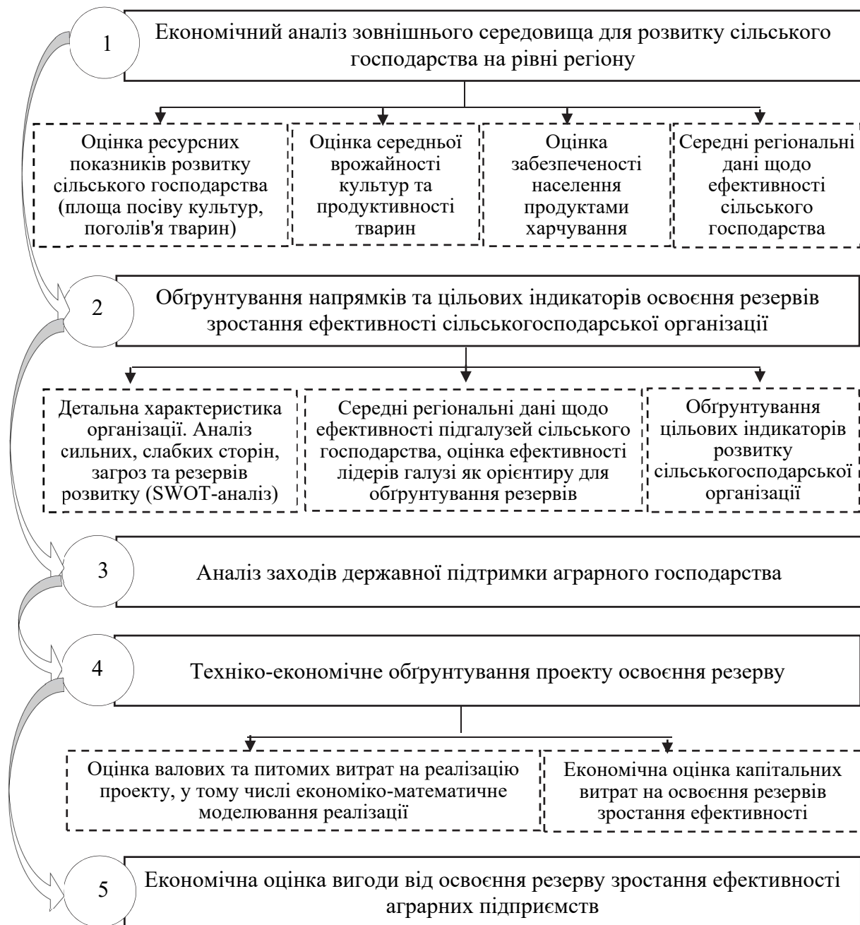
Рис. 2. Етапи реалізації методики економічного обґрунтування проектів освоєння резервів підвищення ефективності аграрних підприємств

Застосування методу групування та рівнянь регресії для практичних потреб допустиме лише тоді, коли забезпечується високий рівень об'єктивності та достовірності отриманих розрахункових результатів. З нашої точки зору, на сучасному етапі, для забезпечення об'єктивності та обґрунтованості результатів, необхідно, крім вагомості сукупності, врахованих у розрахунках сільськогосподарських організацій та відносно близьких виробничих умов господарств (за спеціалізацією, аграрною зоною, природними