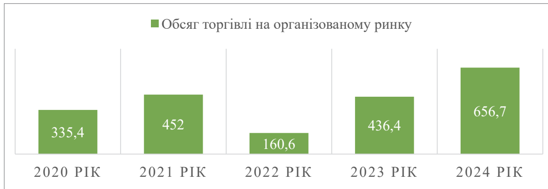
Рис. 1. Динаміка торгівлі на фондових біржах України у 2020–2024 рр., млрд. грн