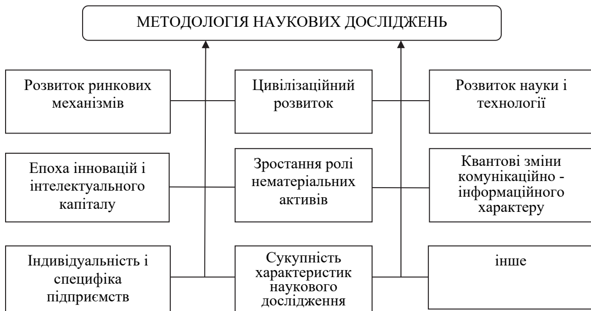
Рис. 2. Чинники впливу на формування методології наукових досліджень

Значимість стратегії в єдності з науковими дослідженнями для ефективного розвитку і конкурентності підприємства визначає потребу введення в науковий і навчальний оборот поняття, а може і дисципліну такого трактування: «методологія наукового дослідження стратегії розвитку підприємства».