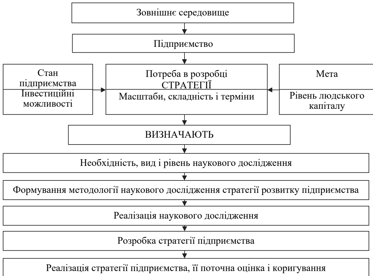
Рис. 3. Зв'язок стратегії розвитку підприємства з науковим дослідженням