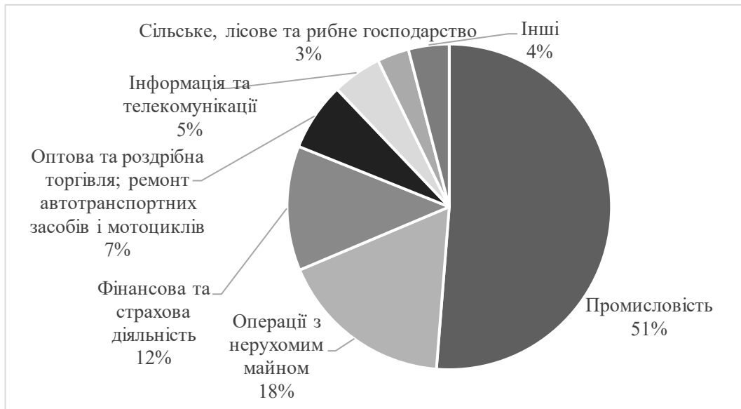
Рис. 2. Галузева структура зовнішніх інвестицій у Львівську область у 2023 році, %

розвиненою інфраструктурою (наявністю індустриальних парків, бізнес-інкубаторів, доступом до кваліфікованих кадрів) ефект зовнішніх впливів виявляється найбільш вираженим.