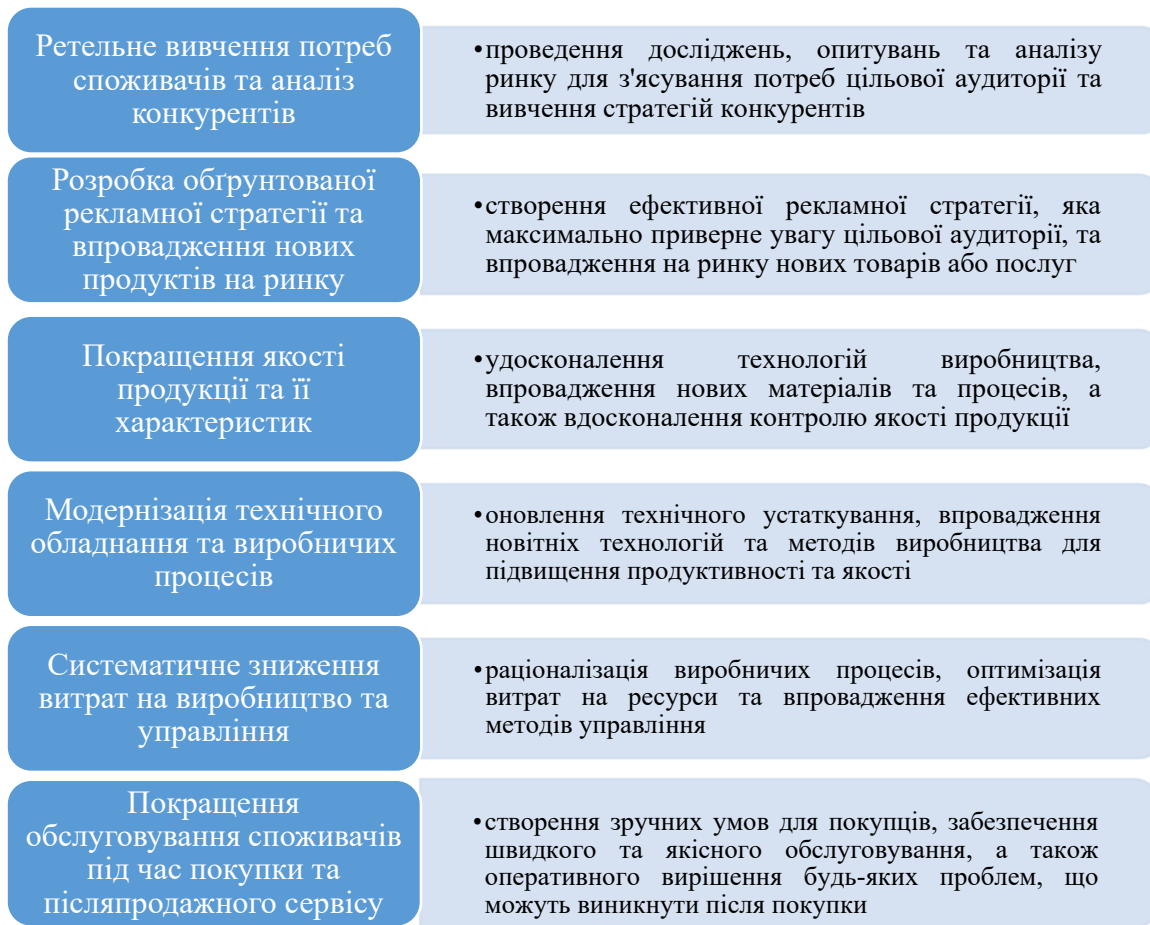
Рис. 2. Основні заходи підвищення конкурентоспроможності підприємства