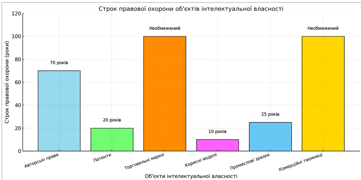
Рис. 2. Строк правової охорони об'єктів інтелектуальної власності

[16], «Про охорону прав на промислові зразки» [17]. «Про охорону прав на компонування напівпровідникових виробів» [18]. Крім того, різні об'єкти права інтелектуальної власності мають різний строк правової охорони. Наприклад, авторське право діє протягом життя автора та 70 років після його смерті, тоді