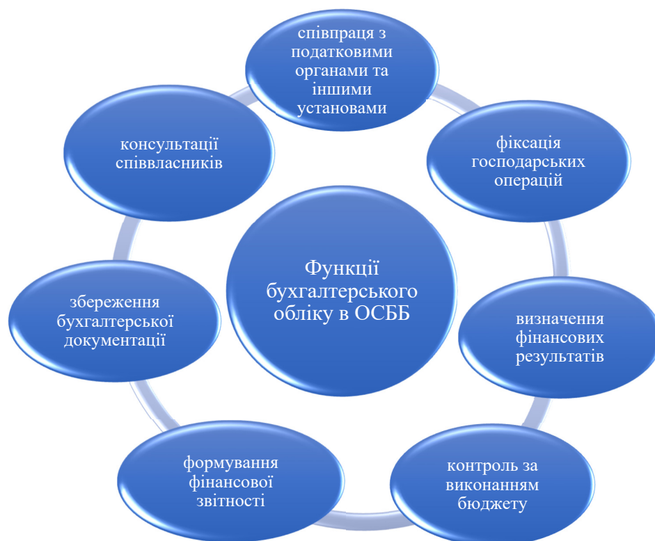
Рис. 2. Основні функції бухгалтерського обліку в ОСББ