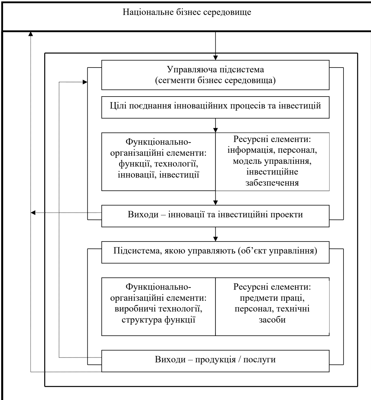
Рис. 3. Системна модель управлінського забезпечення поєднання інноваційних процесів та інвестицій для формування активного бізнес-середовища

Висновки та перспективи подальших досліджень. Досліджено роль інновацій у забезпеченні адаптації бізнесу до сучасних викликів, включаючи цифровізацію, зміни споживчих уподобань та посилення екологічних стандартів, що сприяло формуванню рекомендацій щодо підвищення ефективності інноваційної діяльності. Оцінено вплив інвестицій на гнучкість та стабільність бізнес-середовища, зокрема через створення довгострокових фінансових