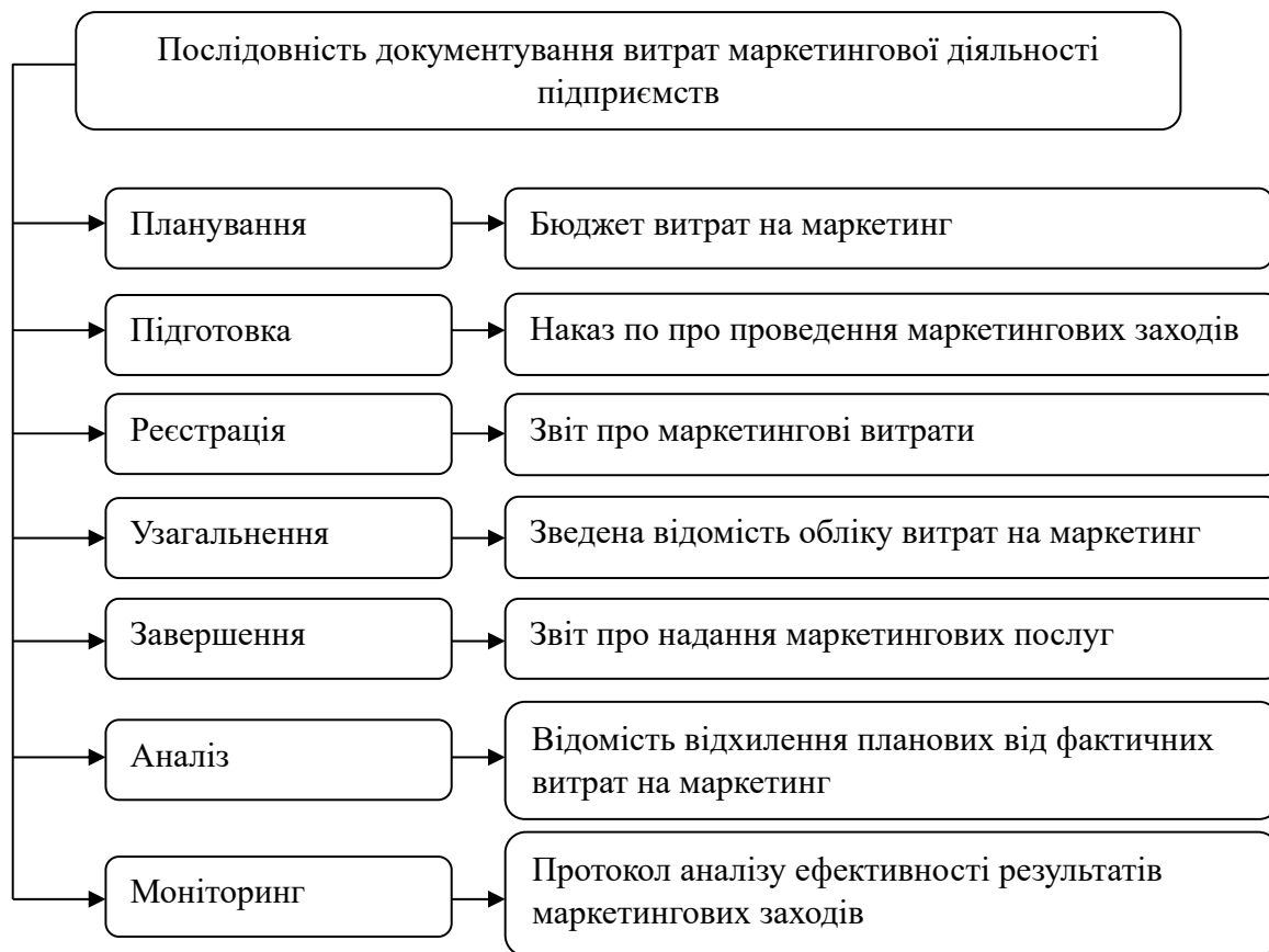
Рис. 2. Документування операцій маркетингової діяльності підприємств для потреб обліку

рентабельності інвестицій. Таким чином, бюджет витрат на маркетинг є ключовим інструментом для управління фінансами в маркетинговій діяльності підприємства, забезпечуючи систематичний підхід до розподілу ресурсів і контролю витрат.