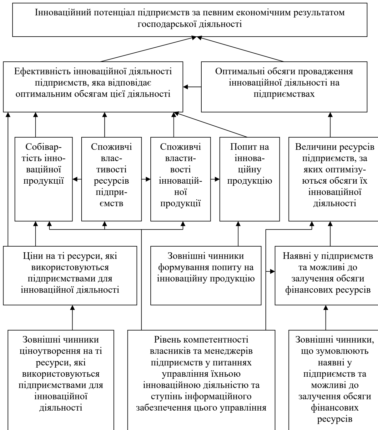
Рис. 1. Ієрархія чинників формування інноваційного потенціалу підприємств

моментом часу, наявністю механізмів управління та іншими ознаками. Також варто відзначити існування значної кількості чинників та складного механізму формування інноваційного потенціалу компаній. Зокрема, такі чинники можуть бути поділені за місцем розташування, здатністю до змін, можливістю керування, характером впливу та іншими ознаками групування. Провідну роль у системі цих чинників відіграє ресурсне забезпечення інноваційної діяльності компаній. Тому формування стратегічного інноваційного потенціалу підприємства відбувається завдяки