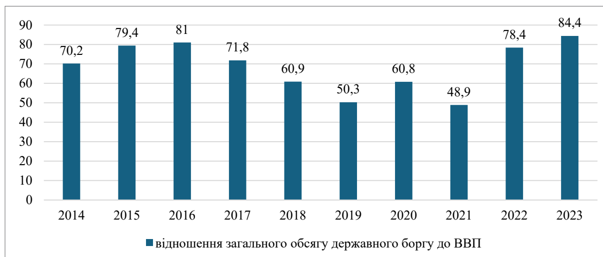
Рис. 1. Відношення державного боргу до ВВП у 2014–2023 рр., %