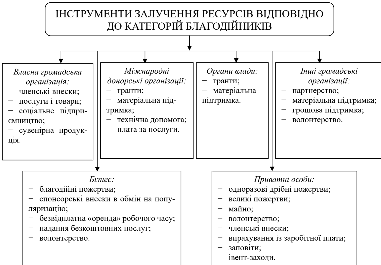
Рис. 1. Інструменти залучення фінансових ресурсів

Відповідно до пп. 5 ст. 1 Закон України № 848-VIII від 26.11.2015 року «Про наукову і науково-технічну діяльність» грант — фінансові чи інші ресурси, надані на безоплатній і безповоротній основі державою, юридичними, фізичними особами, у тому числі іноземними, та (або) міжнародними організаціями для розвитку матеріально-технічної бази для провадження наукової та науково-технічної діяльності, проведення конкретних фундаментальних та (або) прикладних наукових досліджень, науково-технічних (експериментальних) розробок, зокрема на оплату