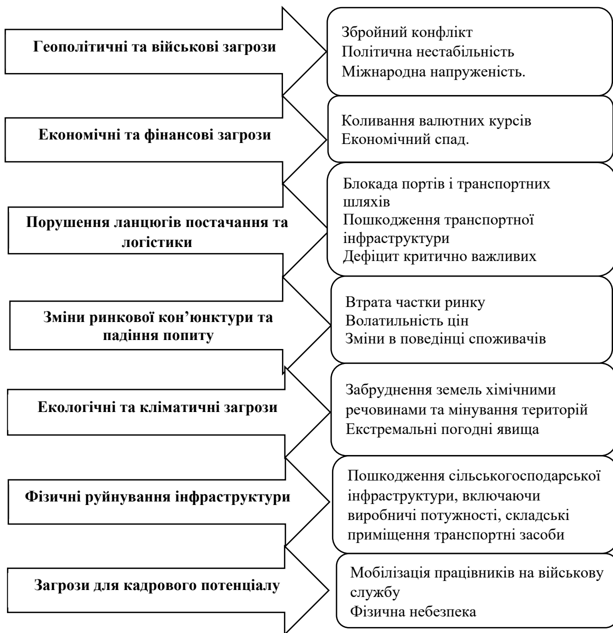
Рис. 3. Зовнішні загрози економічній безпеці сільськогосподарських підприємств в умовах воєнного часу

Факторами економічної безпеки є умови та обставини, що впливають на рівень економічної безпеки