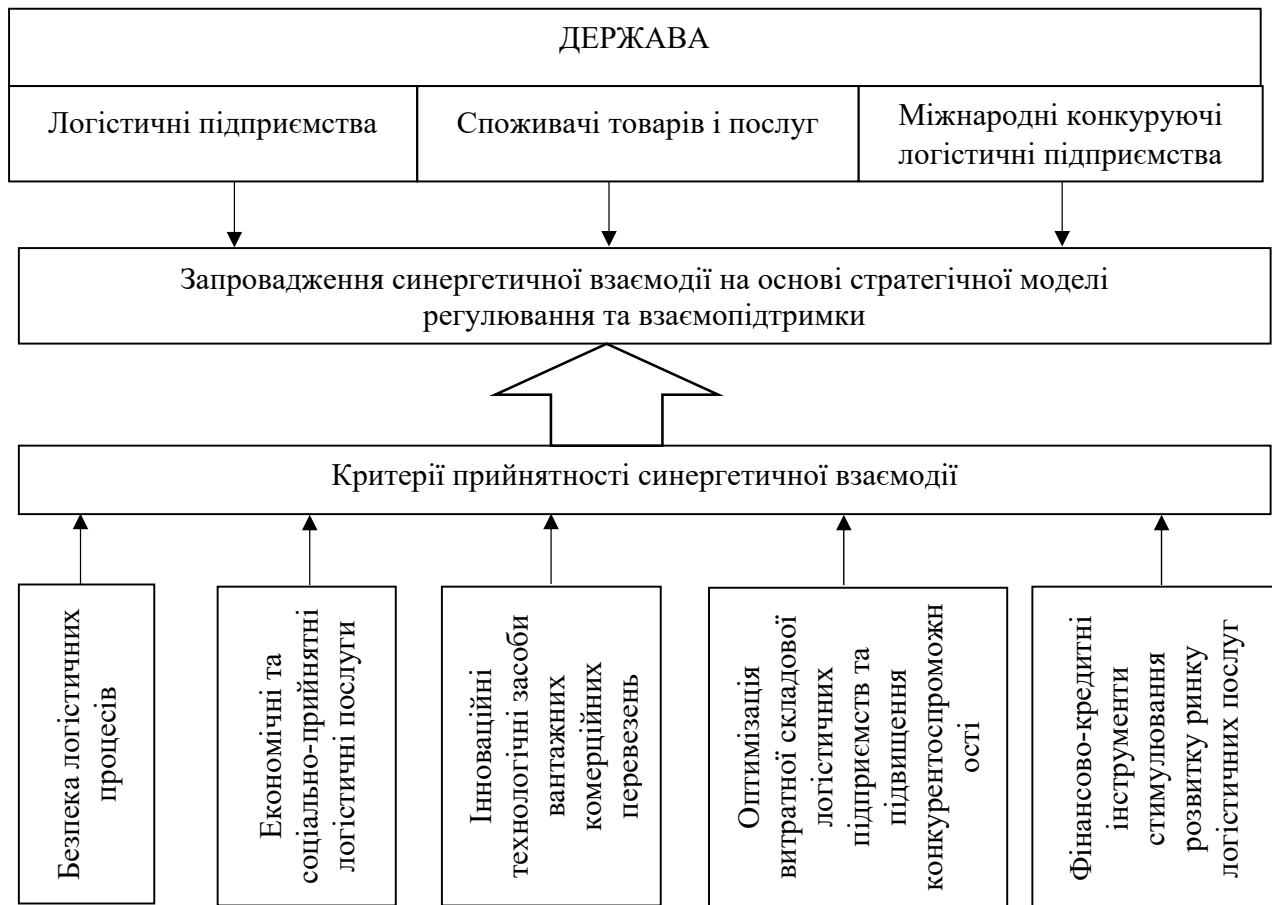
Рис. 2. Регулюючі процеси суб'єктної взаємодії на ринку економічних послуг за умови критеріїв прийнятності

Підсумовуючи концептуалізацію та аналітичні результати слід розуміти, що конкуренція на сьогодні з міжнародними логістичними підприємствами є не доцільною. Можливий варіант-лишень в пло-