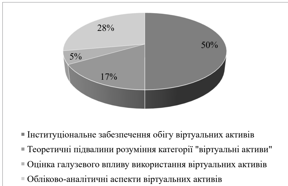
Рис. 1. Розподіл публікацій за результатами бібліографічного аналізу

та пропонує класифікацію суб'єктів, які взаємодіють у системі обліку цифрових даних на базі технології розподіленого реєстру.