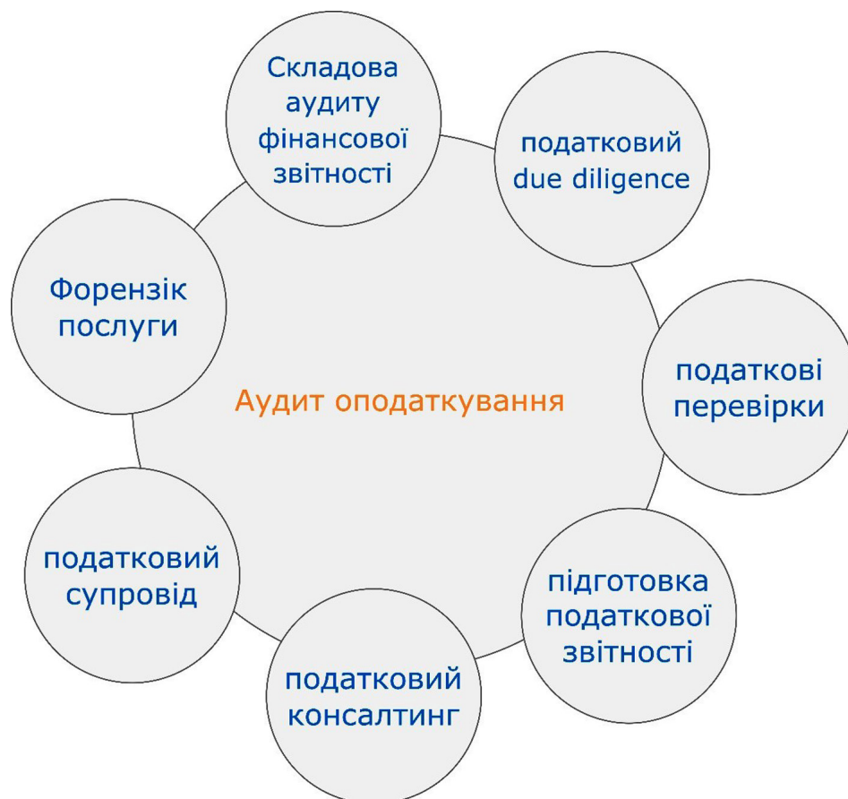
Рис. 1. Основні напрями аудиту оподаткування