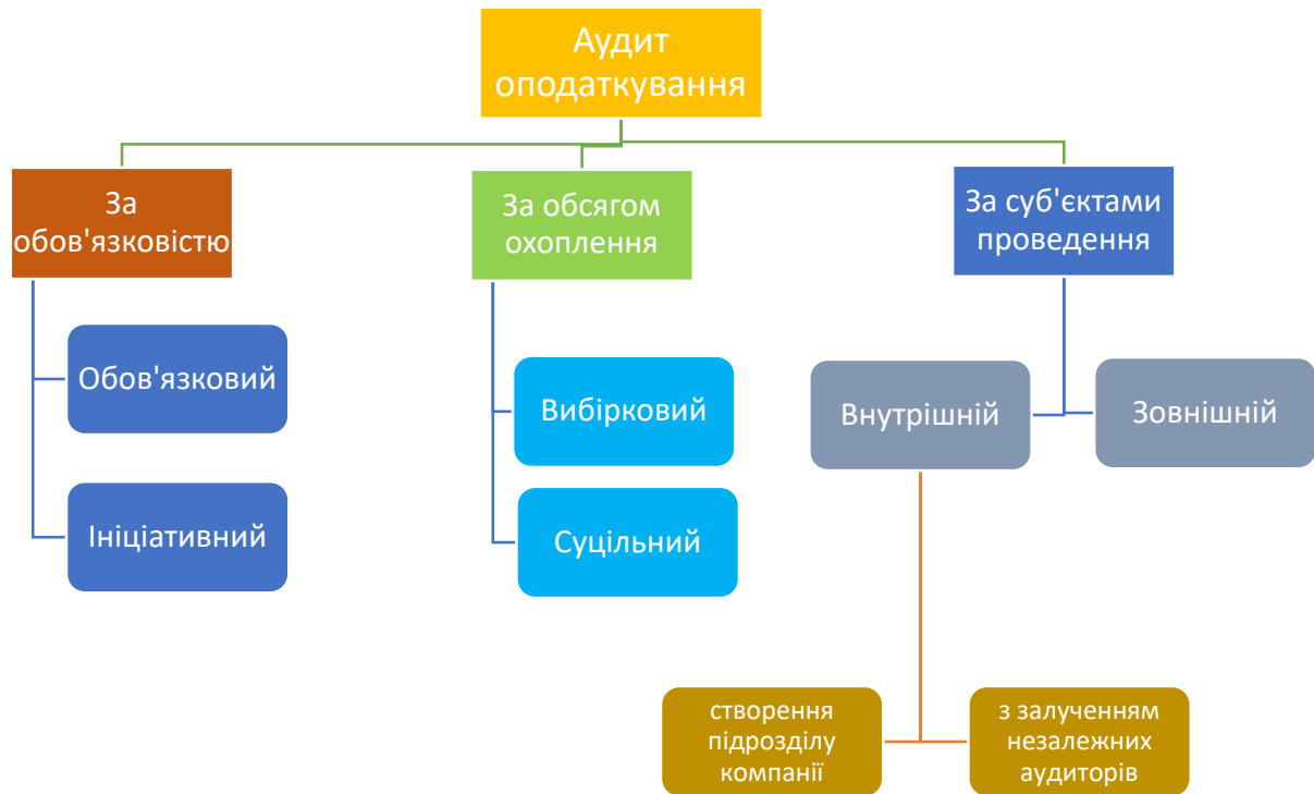
Рис. 2. Узагальнена класифікація аудиту оподаткування за обов'язковістю, обсягом охоплення та суб'єктами проведення