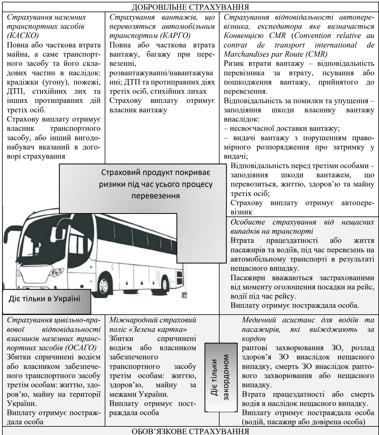
Рис. 3. Перелік ризиків, що виникають при міжнародних перевезеннях та покриваються страховими продуктами з визначенням території покриття